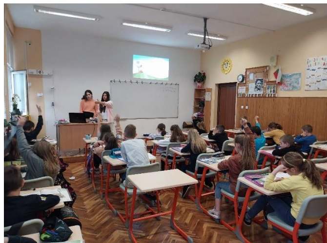
Денят на ученическото самоуправление – големи обучават малки – 9 май 2023 г.