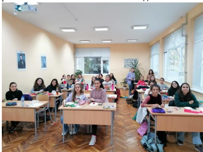
Ученическият парламент по време на работилниците за изделия за Коледния благотворителен базар – декември 2022 г.

На ниво УСП, всяка паралелка, която успя да избере своите петима отговорници, се справи и с изграждането на работни екипи с тях в петте основни дейности.